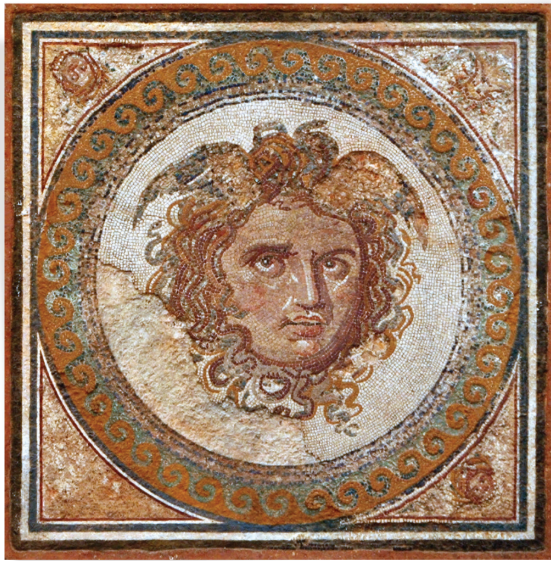
Mosaico da Medusa, século III. Arte Romana. Pedacos de mármore. Museu Nacional Arqueológico, Tarragona.