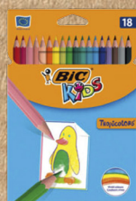
LÁPIS DE COR BIC®Kids Tropicolors