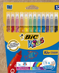
CANETAS DE FELTRO BIC®KIDS Kid Couleur