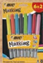
MARCADORES PERMANENTES DE CORES BIC® MARKING