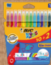
CANETAS DE FELTRO BIC® KID COULEUR